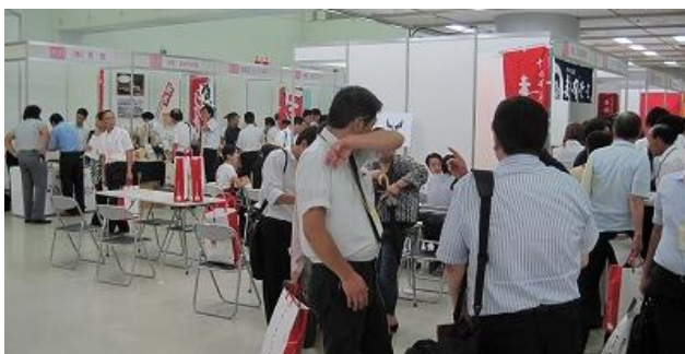
玉川酒造(株)ブース コーヒリーキュール他を展示

U-bigからは(株)大沢加工、玉川酒造(株)、ホリカフーズ(株)、(株)ゆのたにの4社が出展しました。台風15号の影響で鉄道や道路の交通が乱れるなど各地で被害が発生しましたが、会場内は活気に溢れ大変盛況でした。