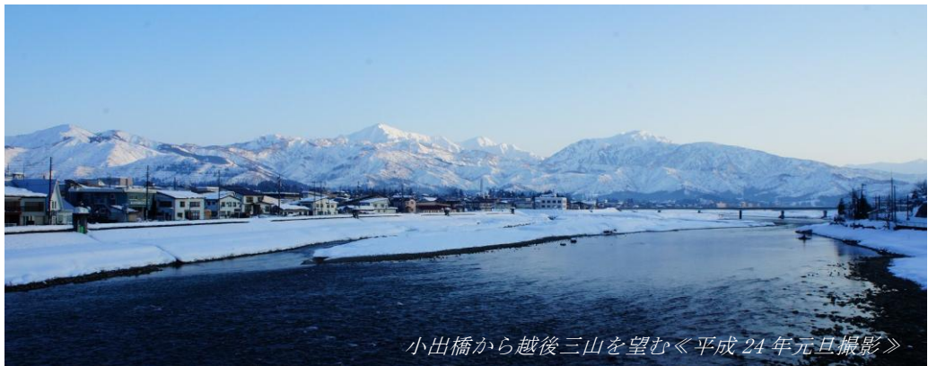
小出橋から越後三山を望む《平成24年元旦撮影》