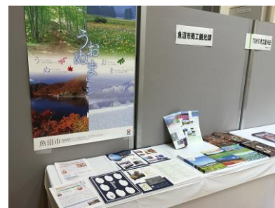
魚沼市とU-bigのPRブース

今年は、「名刺交換しませんか？」をテーマに新たなビジネスチャンスのきっかけづくりとして、異業種間の情報交換が行われていました。名刺の交換だけではなく、実際の製品やカタログを使用して自社のPRを行っていました。また、18種類のミニセミナーでは、参加企業の成功談や営業ポイントについて紹介されていました。参加者は約150名となり会場全体が活気に溢れていました。