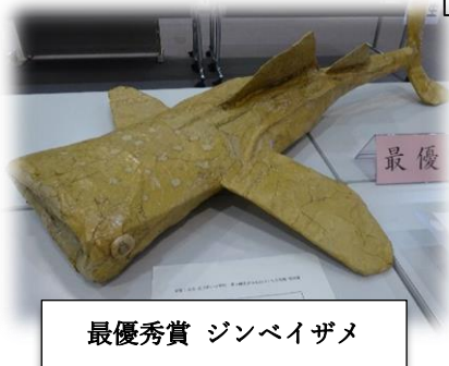
最優秀賞 ジンバイザメ