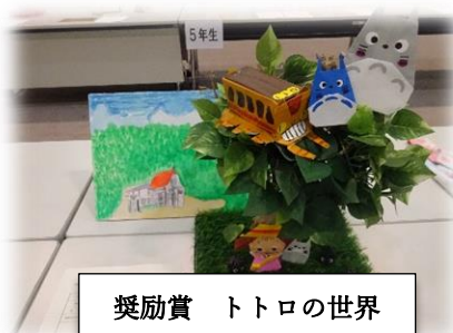
奨励賞 トトロの世界