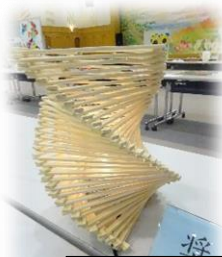
奨励賞 わりばしでシェードランプ