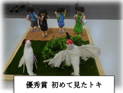
優秀賞 初めて見たトキ