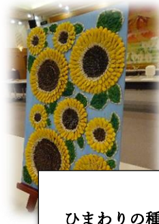
優秀賞 ひまわりの種で作ったひまわりの花