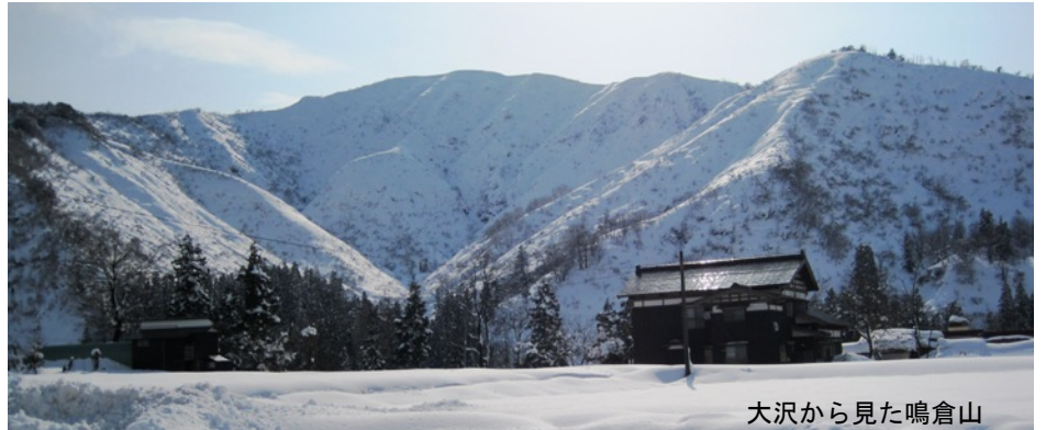
大沢から見た鳴倉山