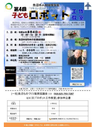
※②子どもロボット工作教室チラシ