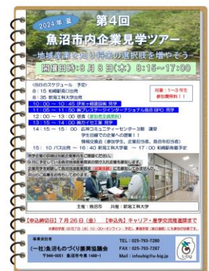
※⑤新潟工科大市内企業見学ツアーチラシ