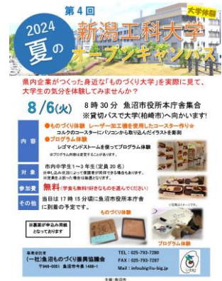
※③新潟工科大オープンキャンパスチラシ