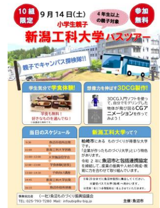
※⑨新潟工大親子バスツアーチラシ