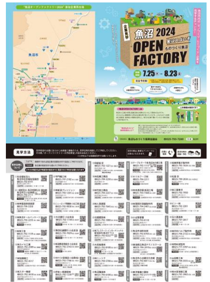
※①オープンファクトリーチラシ

開催日 9月12日(木) 対象 市内中学1年生(5校) 会場 魚沼市地域振興センター ○魚沼市内の企業18社が仕事内容や、働き方などを説明します。地元企業を「知る」第一歩です。