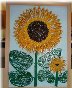
トイレットペーパーのしんで 作ったヒマワリ