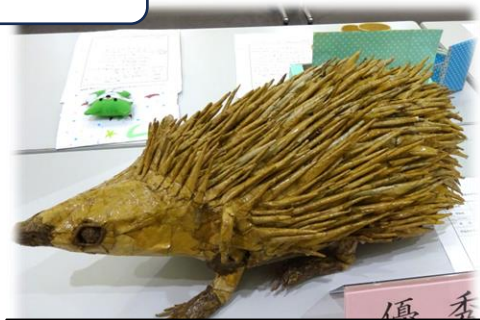
優 季 ハリネズミ