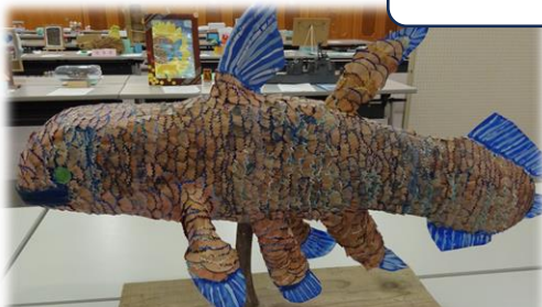
新潟県発明協会会長賞 勉強の足あと(えんぴつの削りかす) から生まれたシーラカンス