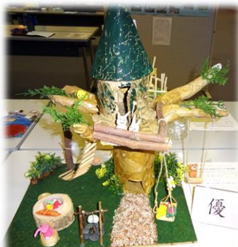
優 にぎやかまりのつりーはうす れすとらん